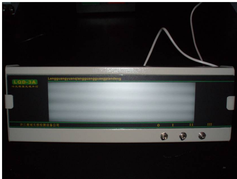
图 3 冷光源强光观片灯