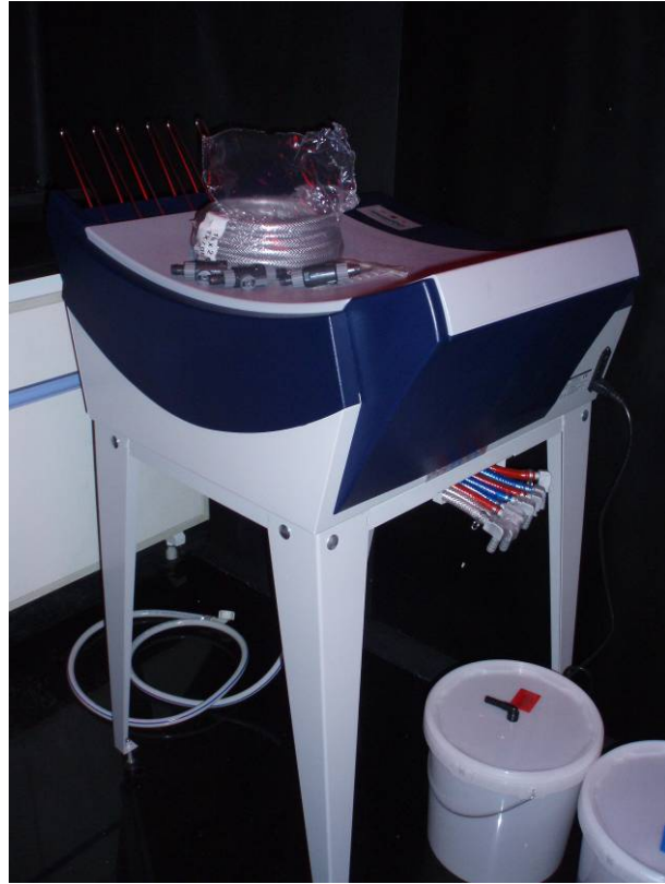
图 2 自动洗片机