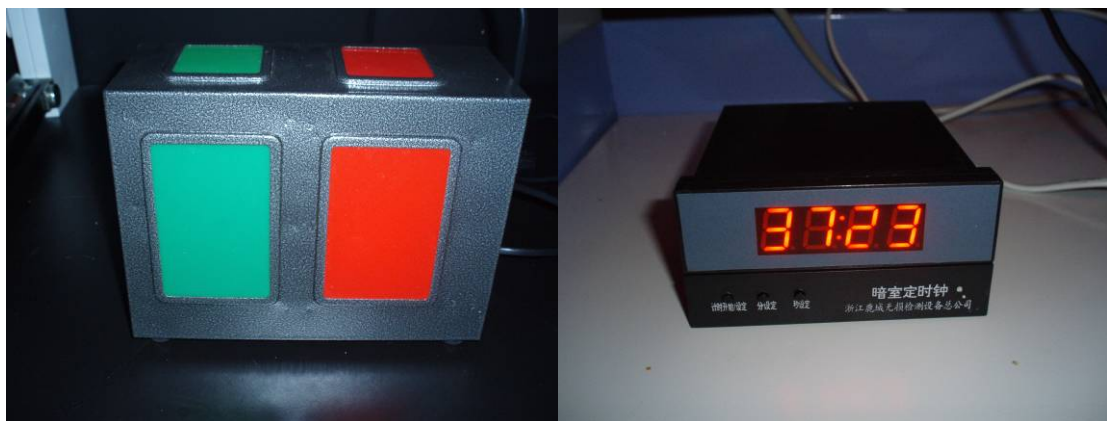
图4 红绿双色灯（左）和暗室计时灯（右）