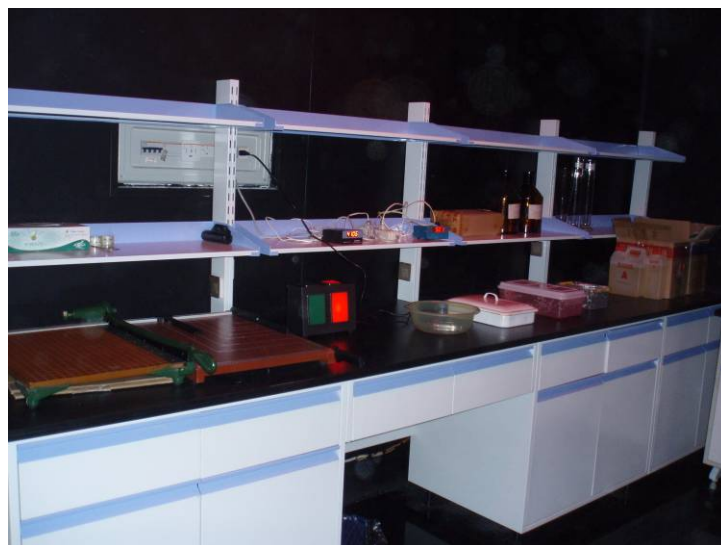
图 1 暗室内部布局